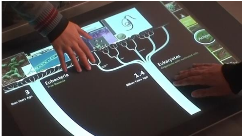
Figur 1. Deep Tree – En interaktiv pekbordsapplikation.